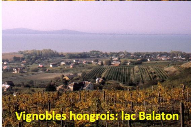
Vignobles hongrois: lac Balaton