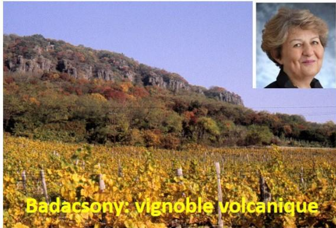
Badacsony: vignoble volcanique