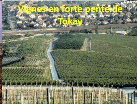
Vignes en forte pente de Tokay