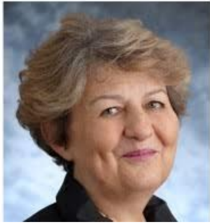
Le sourire de Bori/Bori's smile